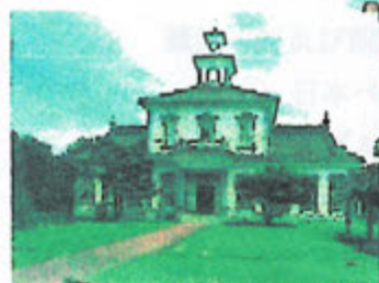
鉄道博物館 (鶴岡市)